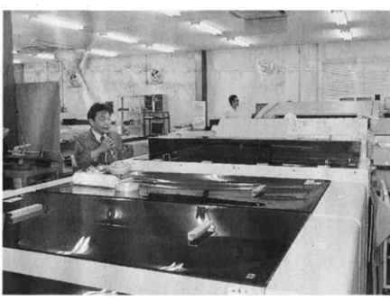
水なし専用として使用される富士フイルム Luxel T-9800のライン

「水なし印刷」を実現する水なし印刷の可能性について、柴崎社長は「導入した機械は、それまで生産効率が悪かったため半年間稼働していません。効果が高く、コスト削減など、導入の実際を解説し、タケミ柴崎社長が講師を務めた。