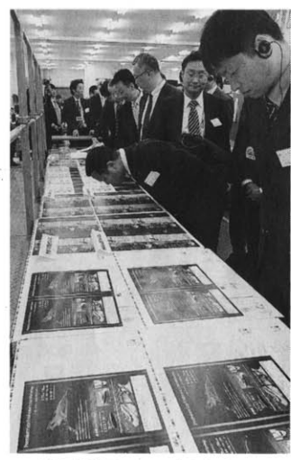
LED-UV機による水なし印刷サンプルを見る参加者

◆事故報告をイントラネット集約 創業以来、大阪の印刷業界のみならず、受託製造専門の印刷会社として活動してきた。もともと製版のオフセットから始まり、デジタル印刷に進出した。印刷と最終工程まで一括で行っていた。そのため、企画デザイン、営業は持たず、完全受託型で印刷の仕事をしたい。当社には1千数百社程度のユーザーがいるが、特に印刷通版「プリントレス」が爆発的に伸びている。また、平成14年からプリントレス、金営業所など会社内で起きたすべての事故、クレーム、ミス、ロスやイントラネット