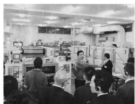
水なし対応が進むLED-UV機(左)