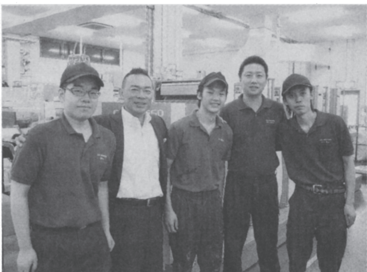
製造業としての誇りを全社で共有

同社は昨年、水なし印が進む2台の主力マシン「J-Print」(菊全 精度や作業性向上に成功 刷技術の採用で、老朽化 化されている同社では、